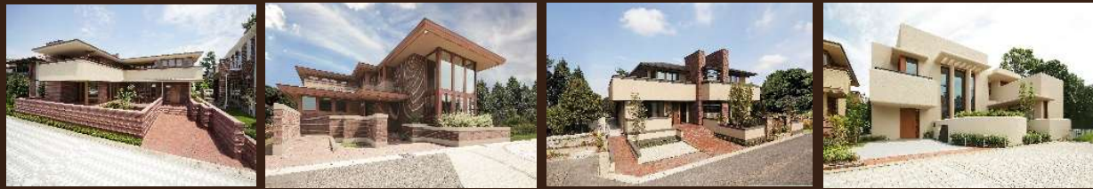
AZALEA(アザレア) KEYSTONE(キーストン) MILLRUN(ミルラン) Moonstream(ムーンストリーム)

フランク・ロイド・ライト財団により日本で唯一認定されている「日本オーガニックアーキテクチャー」から優良住宅会社として、ライセンスを付与され、「オーガニックハウス」と名乗れるのは、岩手県は弊社だけ。